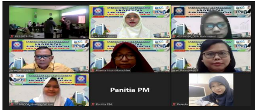
Gambar 3 Kegiatan Pelatihan

diadakan para guru. Dalam hal ini guru memberikan link Jamboard yang sudah di siapkan kepada para murid agar dapat memberikan jawaban atas pertanyaan yang diberikan. Tentu saja para guru harus memberikan penjelasan mengenai cara menjawab pertanyaan dengan menggunakan Jamboard sehingga para murid memahaminya sesuai dengan tujuan pemberian tugas.