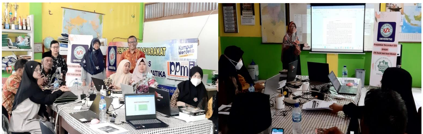
Gambar 2. Pelatihan Ms.Power Point

Berikut merupakan dokumentasi selama kegiatan Pengabdian Masyarakat yang telah dilaksanakan pada TPQ Darul Hikmah.