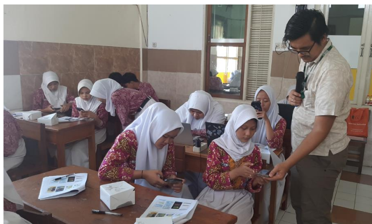
Gambar 2. Foto Kegiatan Praktik dan Pendampingan Pendaftaran Akun Platform

Sebelum pelatihan dimulai, peserta diminta menjawab pertanyaan mengenai minat mereka dalam menjual video dan foto serta kebutuhan untuk mempelajari caranya. Ini bertujuan untuk menilai niat dan motivasi mereka sebelum memulai pelatihan. Hasil jawaban peserta disajikan dalam Tabel 1.