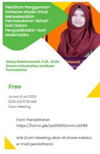
Gambar 1. Poster Kegiatan Pelatihan

Gambar 1 merupakan poster yang digunakan sebelum kegiatan pelatihan penggunaan software Maple untuk menyelesaikan permasalahan sehari-hari dalam pengaplikasian teori matematika terlaksana. Link pendaftaran untuk pelatihan ini melalui https://forms.gle/qx63RifADmrmJbPB9 .