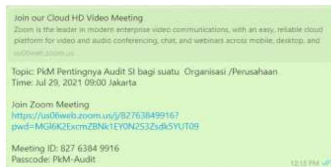
Gambar 1. Undangan Pelatihan

Link kegiatan diberikan menggunakan aplikasi zoom: https://us06web.zoom.us/j/82763849916?pwd=MGl6K2ExcwZBNk1EY0N2S3Zsdk5YUT09 yang disampaikan melalui Group WhatsApp pihak Fakultas Informatika sebagai fasilitator kegiatan yang dijelaskan pada gambar 1.