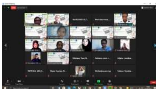
Gambar 2. Screen capture Pelaksanaan PkM via Zoom

Kegiatan PkM diikuti dengan sangat antusias hal ini ditunjukkan dari banyaknya pertanyaan yang disampaikan oleh peserta kepada narasumber mengenai materi pentingnya audit sistem informasi pada suatu perusahaan atau organisasi.