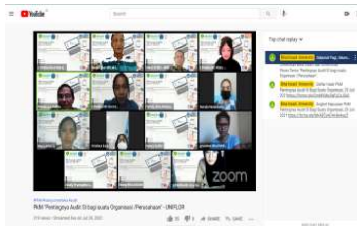
Gambar 3. Kegiatan PkM via youtube

via link: https://www.youtube.com/watch?v=oDNIU5Sv7kY yang dijelaskan pada gambar 3.