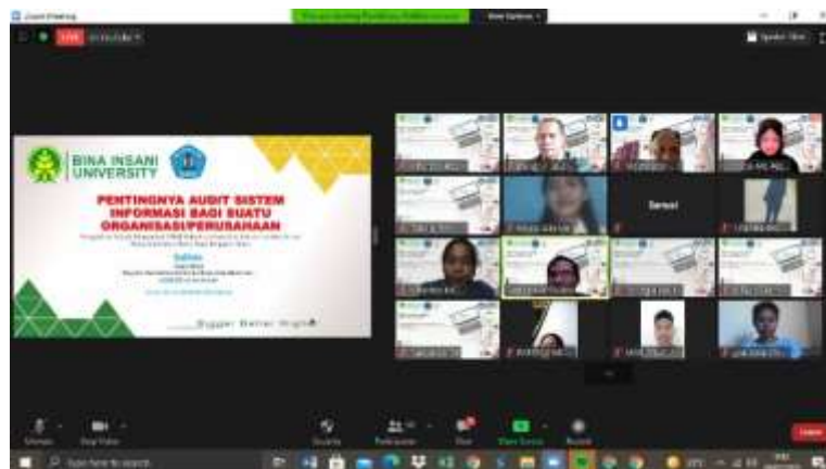
Gambar 4. Materi PkM