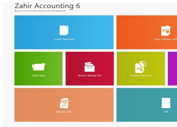
Gambar 2. Tampilan Menu Utama Zahir-Accounting