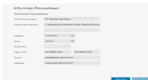
Gambar 3. Tampilan Informasi Perusahaan

Pada form menu menu utama, pilih create Data Baru, maka akan tampilan seperti pada dibawah ini. berikutnya input form informasi pada perusahaan sesuai dengan data pada perusahaan yang sudah diberikan oleh perusahaan itu sendiri, jika sudah menyelesaikan mengisi form maka selanjutnya lakukan dengan klik untuk lanjutkan.