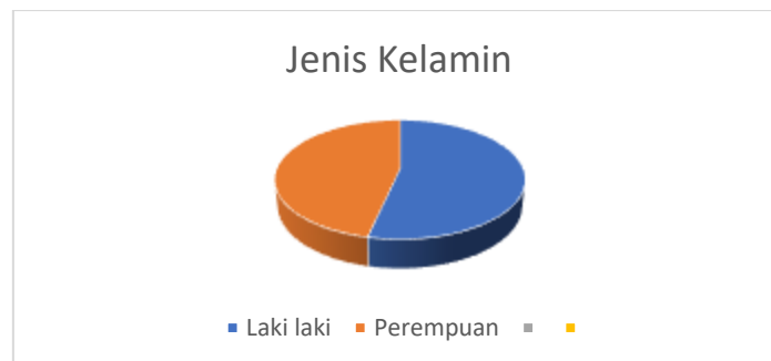
Gambar 8. Distribusi frekuensi Responden Responden berdasarkan jenis kelamin (2024)

Peningkatan yang terjadi pada mitra dalam bentuk data terukur disajikan dalam bentuk table Rekapitulasi Hasil Pengolahan Data Kuesioner Kegiatan Pengabdian Masyarakat Periode Semester Genap 2024 Universitas Bina Sarana Informatika. Kegiatan PKM didapatkan hasil bahwa peserta laki laki lebih banyak dari pada peserta perempuan seperti yang ditunjukkan pada Gambar 8.