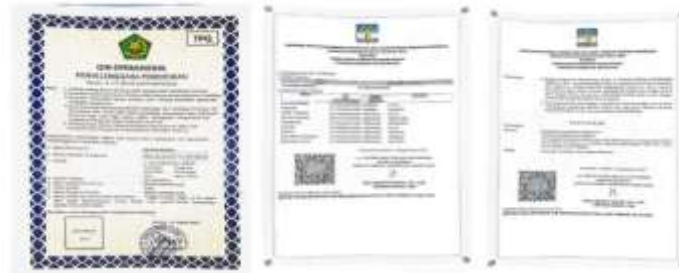
Gambar 1. Perijinan pendirian TPA Yayasan Hasanah AR-Rasyidiyah

Kondisi terkini mitra yang tidak produktif secara ekonomi / sosial. Tahapan pengabdian kegiatan masyarakat meliputi tahapan persiapan dan tahapan pelaksanaan, melakukan tahap persiapan untuk mengetahui permasalahan yang dihadapi oleh Yayasan Hasanah AR-Rasyidiyah. Mitra bergerak di bidang pendidikan khususnya tempat Pendidikan Al Quran (TPQ) yang kebanyakan muridnya masih tingkat sekolah dasar.