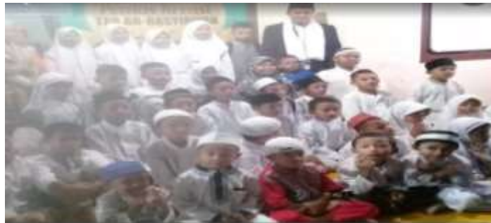
Gambar 2. TPA Yayasan Hasanah AR-Rasyidiyah (Robi, 2023)

Kondisi terkini mitra yang tidak produktif secara ekonomi / sosial. Tahapan pengabdian kegiatan masyarakat meliputi tahapan persiapan dan tahapan pelaksanaan, melakukan tahap persiapan untuk mengetahui permasalahan yang dihadapi oleh Yayasan Hasanah AR-Rasyidiyah. Mitra bergerak di bidang pendidikan khususnya tempat Pendidikan Al Quran (TPQ) yang kebanyakan muridnya masih tingkat sekolah dasar.