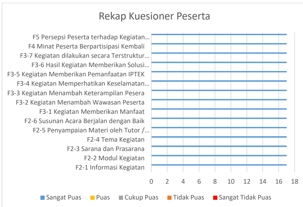
Gambar 10. Rekap Perhitungan Frekuensi Jawaban 17 Responden (2024)

Gambar 10 di bawah ini merupakan hasil rekapitulasi emosional para peserta yang terlibat dalam kegiatan pengabdian masyarakat dosen, mahasiswa, dan peserta kegiatan sebagai responden, terdiri dari : informasi kegiatan pada saat pelaksanaan, materi/modul pelatihan/kegiatan, sarana dan prasarana, tema kegiatan, tutor / narasumber menyampaikan materi, Susunan acara berjalan dengan baik, memberikan manfaat bagi peserta, menambah wawasan peserta (mengenai tema yang disampaikan, menambah keterampilan peserta sesuai dengan tema yang disampaikan, memperhatikan pertolongan pertama (P3K) luka ringan, memberikan pemanfaatan ilmu pengetahuan berdasarkan pengisian. Kegiatan ini mampu memberikan solusi bagi permasalahan yang dihadapi oleh mitra dan peserta. Mereka sangat antusias mengikuti kegiatan dan banyak memberikan pertanyaan dan mereka mencoba mempraktikkan. Selanjutnya melakukan tahapan monitoring dengan mengerjakan lembar evaluasi berupa kuesioner peserta dan kuesioner mitra.