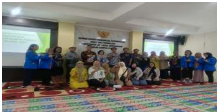
Gambar 7. Foto bersama Tamu Undangan, Peserta Yayasan Hasanah Ar_Rasyidiyah, Kelompok PM Dosen, dan mahasiswa berada di Aula Museum Sumpah Pemuda