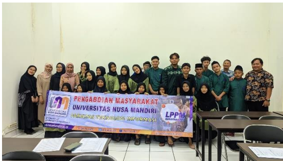
Sumber: (Hasil Pelaksanaan, 2024) Gambar 8 Foto bersama seluruh peserta pelatihan

Gambar 7 merupakan dokumentasi peserta mengisi lembar kuesioner pengabdian masyarakat untuk mengetahui seberapa besar presentase serta tanggapan peserta dari kegiatan pelatihan.