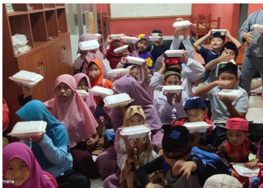
Gambar 3 Kegiatan Yatim dan Piatu Panti Asuhan Yatim Piatu Naelul Khair

Gambar 2 dan Gambar 3 merupakan dokumentasi kegiatan yang dilakukan oleh anak asuh Yayasan Naelul Khair dimulai dari penutupan pengajian sementara guna menyambut malam nisfu syaban hingga kegiatan buka bersama di bulan ramadhan.