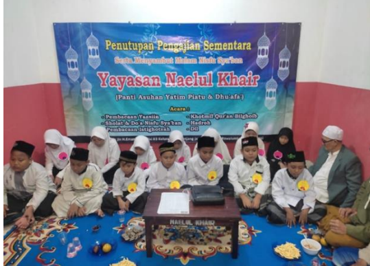
Gambar 2 Aktivitas Yatim dan Piatu Panti Asuhan Yatim Piatu Naelul Khair

Jarak mitra dengan pengusul adalah 13,9 KM Dimana pengusul adalah Universitas Nusa Mandiri yang berlokasi di Jl. Jatiwaringin Raya No.02 Cipinang Melayu. Kec. Makassar Kota Jakarta Timur, Daerah Khusus Ibukota Jakarta 13620 dan Alamat mitra adalah Jl. Bambu Kuning No. 75, RT 002/RW 003, Sepanjang Jaya, Kecamatan Rawalumbu, Kota Bekasi, Jawa Barat.