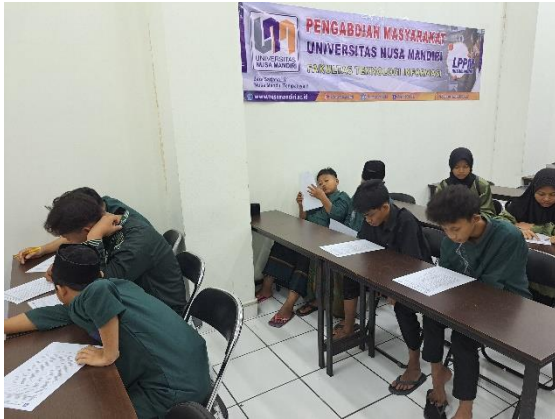
Gambar 7 Pengisian kuesioner peserta

Gambar 7 merupakan dokumentasi peserta mengisi lembar kuesioner pengabdian masyarakat untuk mengetahui seberapa besar presentase serta tanggapan peserta dari kegiatan pelatihan.