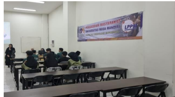
Sumber: (Hasil Pelaksanaan, 2024)

Pertama Peserta diberikan pemahaman fitur-fitur pada Bing Image Creator. Kemudian cara penggunaan aplikasi Bing Image Creator sebagai alat bantu desain konten digital. Selanjutnya tutor mengadakan sesi tanya jawab kepada peserta, dan diakhiri dengan mengisi kuesioner kegiatan pengabdian masyarakat.