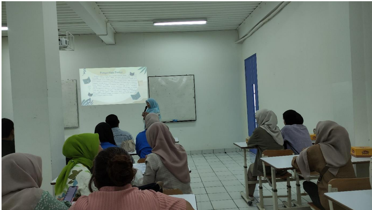
Gambar 1. Tutor Menyampaikan Materi Pelatihan

Toko Clanis Cake Sukabumi yang dihadiri 20 orang dan berlangsung dari jam 08:00-15:00 WIB. Kegiatan pengabdian masyarakat ini dimulai dengan pembukaan oleh ketua panitia, diikuti dengan sambutan dari perwakilan mitra. Setelah sambutan, dilanjutkan dengan acara penyampaian materi tentang pembuatan pamflet dalam menunjang promosi produk di Toko Clanis Cake Sukabumi.