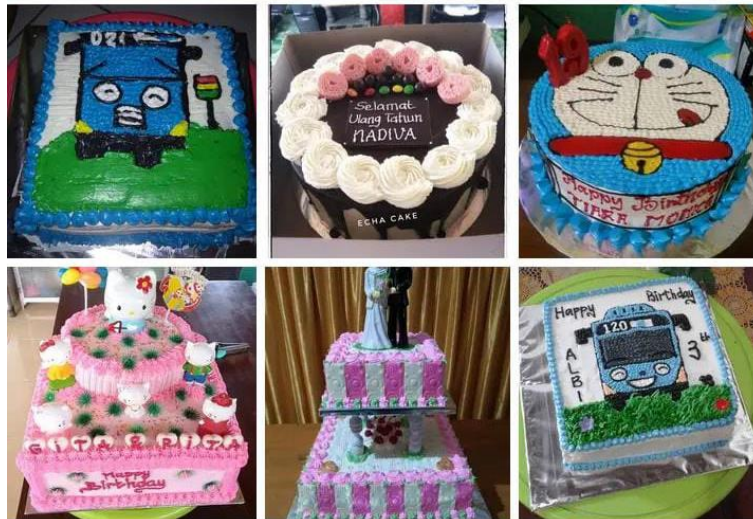
Gambar 1. Macam-macam Kue Ulang Tahun