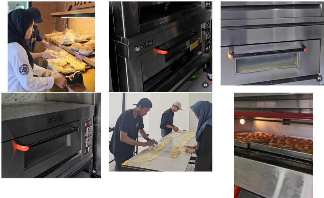
Gambar 3. Fasilitas

Kegiatan penjualan yang ada di Toko Clanis Cake diantaranya sebagai penjualan berbagai aneka kue ulang tahun, brownies dan bolu.