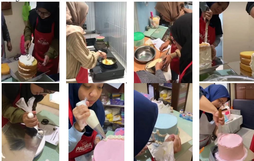
Gambar 2. Kegiatan Produksi