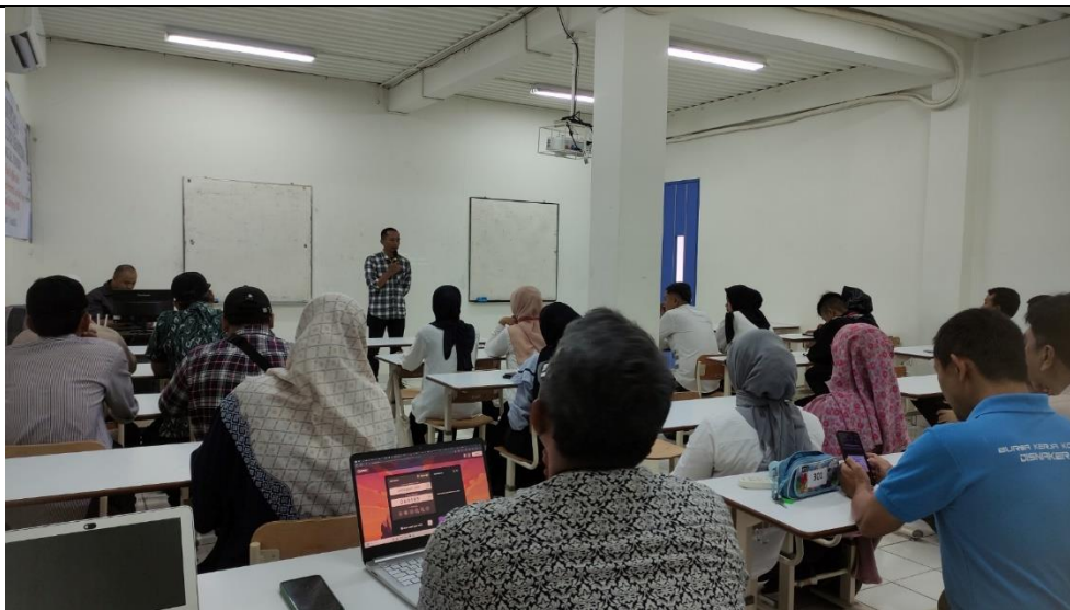
Gambar.2 Pelaksanaan Pelatihan Aplikasi Monitoring Kegiatan Desa

Pelaksanaan pelatihan sistem monitoring kegiatan dilaksanakan dalam ruangan dan menggunakan laptop/pc ataupun menggunakan handphone. Peserta mendapat pelatihan dalam menggunakan sistem monitoring.