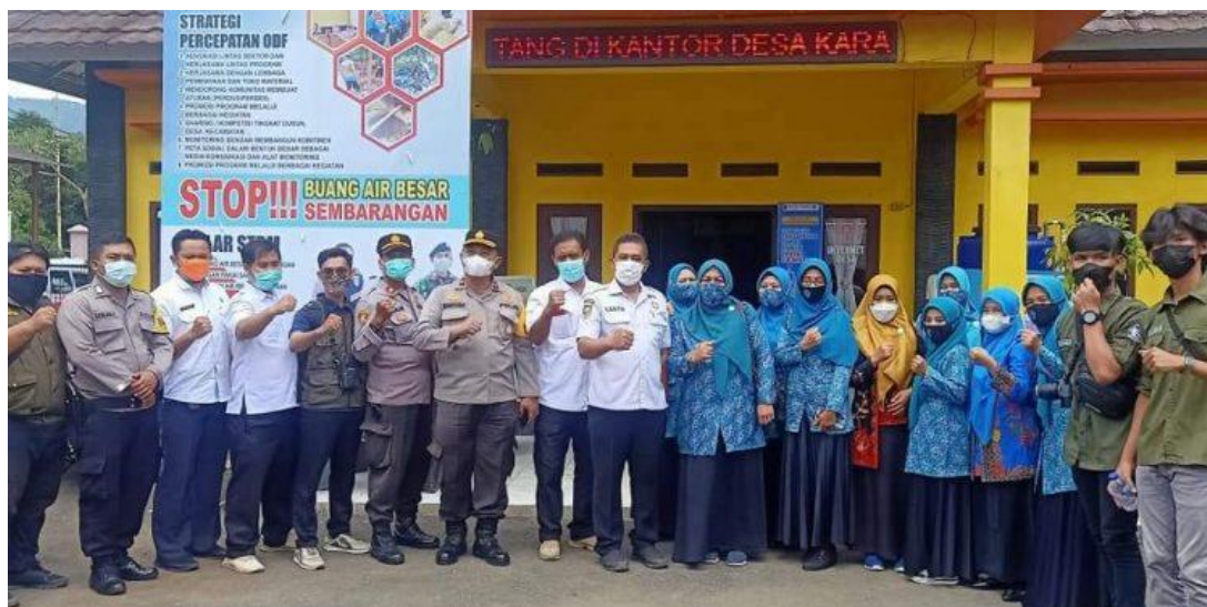
Gambar 2. Photo Mitra