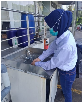
Gambar 5. Area cuci tangan sebelum memasuki kantor

Untuk pencegahan penyebaran virus corona atau covid-19 pada kluster perkantoran di PT. Larisa Nikko Indonesia juga melakukan peraturan lain yang berupa kegiatan Penyemprotan disinfektan disetiap sudut ruang kantor mulai dari lobi depan, sampai area kerja para pegawainya, penyemprotan disinfektan ini dilakukan 2 minggu sekali ketika para pegawai sedang melakukan kegiatan work from home , selain itu tempat cuci tangan di sediakan sebelum pintu masuk kantor sebagai bentuk strategi komunikasi memberikan edukatif kepada para pegawai.