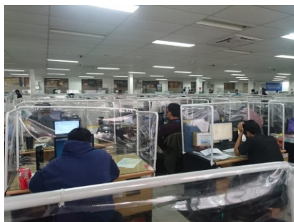
Gambar :5. Ruang Kerja

Strategi komunikasi ini di harapkan memberikan kesadaran dan pemahaman kepada para pegawai dan kegiatan ini menjadi kebiasaan baru yang rutin dilakukan pada kehidupan sehari-hari. komunikasi mengajak dan memberikan informasi edukatif namun tanpa ada unsur pemaksaan, namun memberikan rasa nyaman kepada khlayak yang dituju, strategi komunikasi memiliki tujuan untuk memberikan pengaruh kepada komunikan atau receiver yaitu pegawai PT. Larisa Nikko Indonesia dari komunikator.