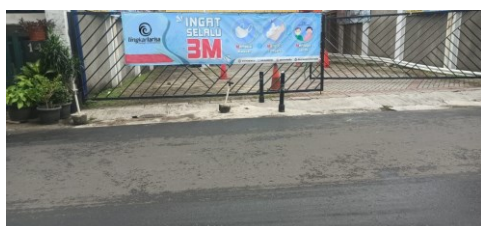
Gambar 2. Himbuan wajib masker pintu gerbang PT. Larissa Nikko Indonesia

Sosialisasi pencegahan penyebaran virus corona pada kluster perkantoran ini dilakukan melalui pesan media whatsapp kepada para pegawainya dan juga selebaran yang ditempelkan diberbagai sudut ruangan kantor. Hal ini dilakukan oleh manajemen PT. Larisa Nikko Indonesia karena dianggap lingkungan kantor yang mobilitas tinggi dan terdapat banyak orang keluar masuk melakukan aktifitas setiap harinya mengingat lingkungan tersebut dapat menjadi tempat penyebaran virus corona atau covid-19.